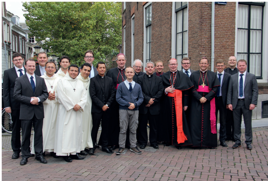
Foto: staf en seminaristen b.g.v. de start van het Ariënsinstituut in september 2014